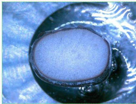
<研磨途中（実体顕微鏡）>