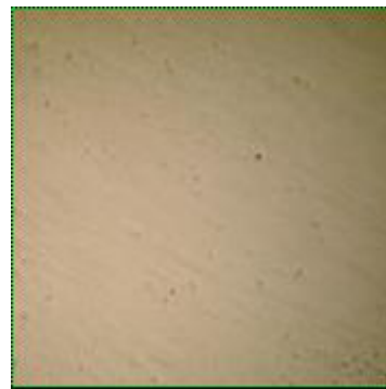
<研磨後 金顕観察結果>